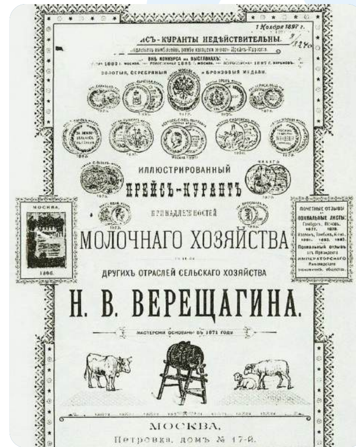
Прейскурант принадлежностей для молочного хозяйства Н. В. Верещагина

лет Верещагин трудился в родном Череповецком уезде, выступая в качестве мирового посредника, разрешая земельные споры между крестьянами. За это время, будучи дворянином, он глубоко изучил