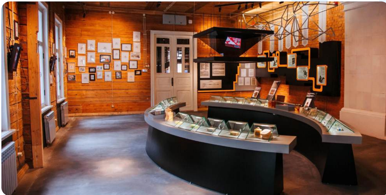
Дом-музей Вологодского масла в Вологде